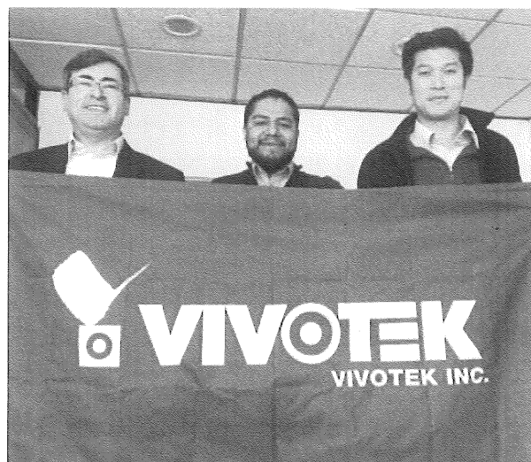
晶睿通訊公司攝於墨西哥市商務中心

https://info.taiwantrade.com/subject/obc